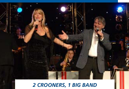
2 CROONERS, 1 BIG BAND