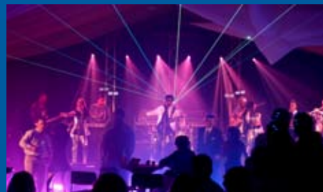
SOIRÉE DU FUTUR / COME TO THE FUTURE