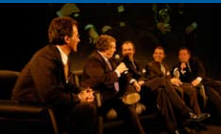
LE TV SHOW / THE TV SHOW

Take a stroll on the wild side and gamble the night away! Viva The Casino is the perfect venue that provides a jackpot filled evening, while you gamble to your heart's content with play money.