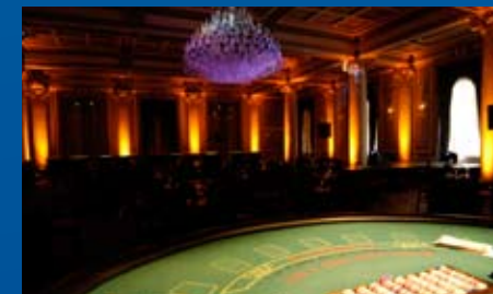
VIVA LE CASINO / VIVA THE CASINO