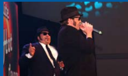
LÉGENDES / LEGENDS