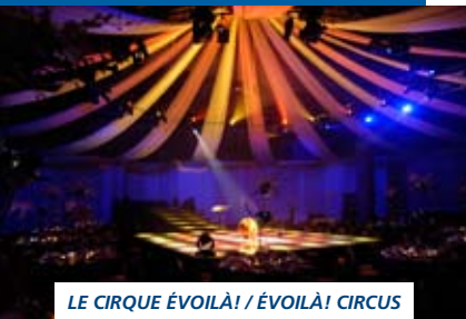
LE CIRQUE ÉVOILÀ! / ÉVOILÀ! CIRCUS

Our Opera Rhapsody features two parts, and special effects are integrated to sensationalize the experience. Part one features our opera singers; part two provides a totally different dance atmosphere where everyone can "trip the light fantastic" and sing along to a great 80's rock program. In addition, a Grand Finale will pay tribute to your guests.